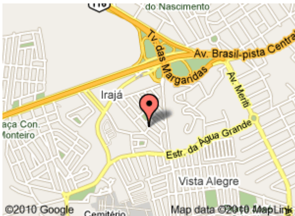
Mapa da Escola Municipal Gaspar Viana

No item Características da Escola, encontramos endereços, telefones, nome da direção, fotos do local e quantidades de sala, de turnos e de alunos.